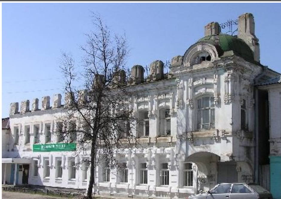
Дом С.С. Панышева, начало XX в. (ул. Свободы, 93). Объект культурного наследия регионального значения. Здание построено тем же автором, что и дом Г.И. Деметьева

Л.М. Каптерев пишет в своей книге, что на правом берегу Сундовика преобладают татарские названия местности, на левом — мордовские. Это говорит о том, что правобережье Сундовика было заселено татарами. Река Сундовик служила пограничной рекой между мордвинами и татарами. Об этом говорит ее название: "Сон Дава", что с татарского переводится, как "Граница владений". В мордовском языке такого или похожего по звучанию слова нет. Можно предположить, что до прихода сюда татар мордвы называли реку Покша ляй (в переводе - Большая река). Об этом напоминает имя урочища Покаляйка. В дальнейшем на берегу реки Сон Дава («Пограничная») был построен городок Соундавит (ныне Лысково). Каптерев пишет, что владел этой территорией князь Муранчик, который, опасаясь набегов Булак-Темира продал остатки разорённых сёл Тарасу