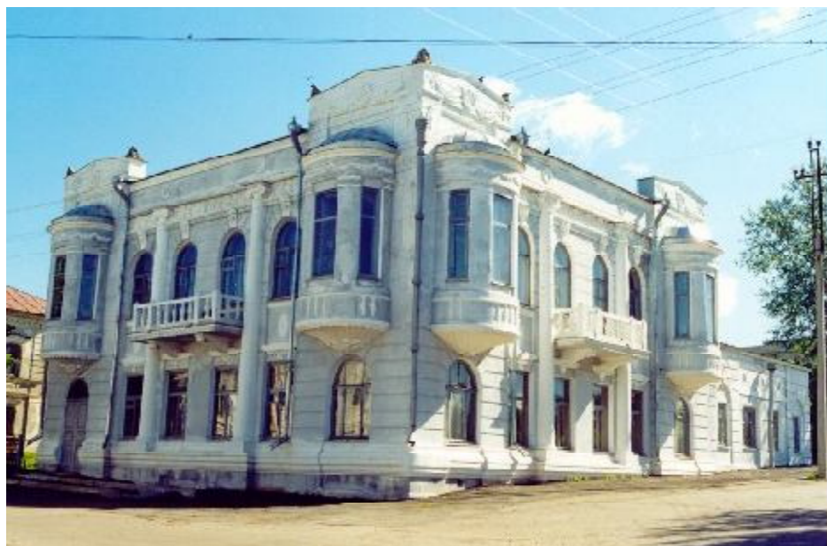
Дом братьев А.И. и В.И. Моневых, 1915 г. (ул. Свободы, 90). Уникальный для нижегородской «глубинки» пример ретроспективизма 1910-х гг. Объект культурного наследия регионального значения. Ныне – историко-художественный музей.

Каптерев Л.М. Нижегородское Поволжье X-XVI веков Кирьянов И.А. Старинные крепости Нижегородского Поволжья. Горьковское книжное издательство, 1961 Материалы районной газеты «Знамя» (автор В.Н. Урусов)