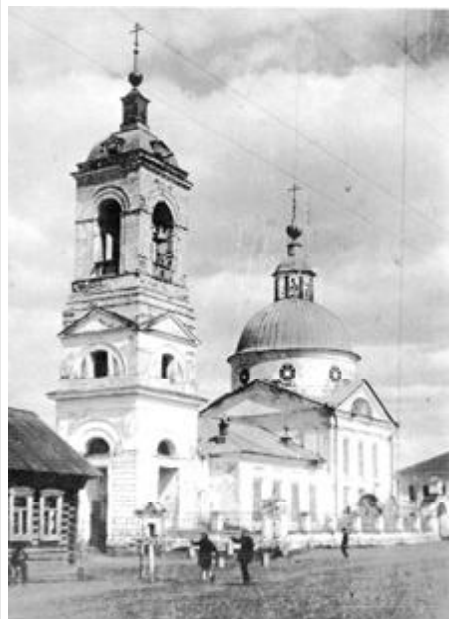
На квадратной площади, на месте нынешней автостанции, находилась Благовещенская церковь, построенная в 1831 году и прилежавшее к ней кладбище.