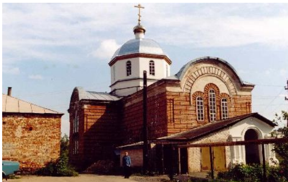
Никольская единоверческая церковь, 1881-1885 гг. (пер. Первого Мая). Являлась частью ансамбля Покровской единоверческой общины. Интересный пример так называемого византийского стиля в русской архитектуре второй половины XIX в. Ныне действует как старообрядческая Аввакумовская церковь.