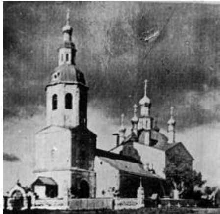
Христо-Рождественский собор, построенный в 1781 году - главный приходской храм Большого Мурашкина