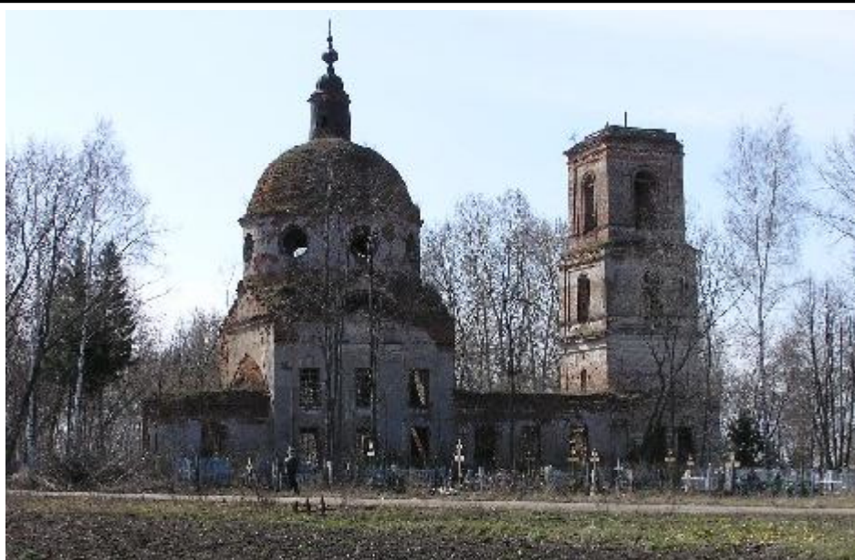
Вознесенская (кладбищенская) церковь, 1856 г. Является образцом позднего классицизма. В настоящее время не используется, находится в аварийном состоянии. Объект культурного наследия регионального значения.

села – Базарная с ансамблем Спасо-Преображенской, Троицкой и Ильинской церквей XVIII и XIX столетий. Троицкая церковь построена в 1805 году на месте женского монастыря, преобразованного в приход в 1764 году. В ансамбль церкви входит также небольшой каменный дом священника в северо-западном углу участка и ограда. Лишь ей - Троицкой церкви – суждено было возродиться. В октябре 1989 года при большом стечении большемурашкинцев этот храм вновь был открыт. Ильинская церковь, построенная в 1733 году, находилась на территории нынешнего сквера в центре Б.Мурашкина. Церковь представляла собой небольшое скромное сооружение, колокольня была пристроена к ней во 2 половине 19 века. Когда Ильинскую церковь сломали, то камень от нее пошел на строительство тротуара, а на фундаменте алтаря жители села возвели летний кинотеатр, а в начале 80-х годов на месте кинотеатра появилась летняя танцплощадка для молодежи. Спасо - Преображенская церковь была построена в 1821 году на месте бывшего мужского монастыря, преобразованного в 1764 г. в приход. К настоящему времени уцелела только нижняя часть церкви (по карниз алтаря и трапезной). Вознесенская (Кладбищенская, Напольная) церковь расположена на территории кладбища, находящегося в конце улицы 1 Мая (бывшей ул. Покровской). Была построена в 1856 году на месте предшествовавшей ей церкви. В настоящее