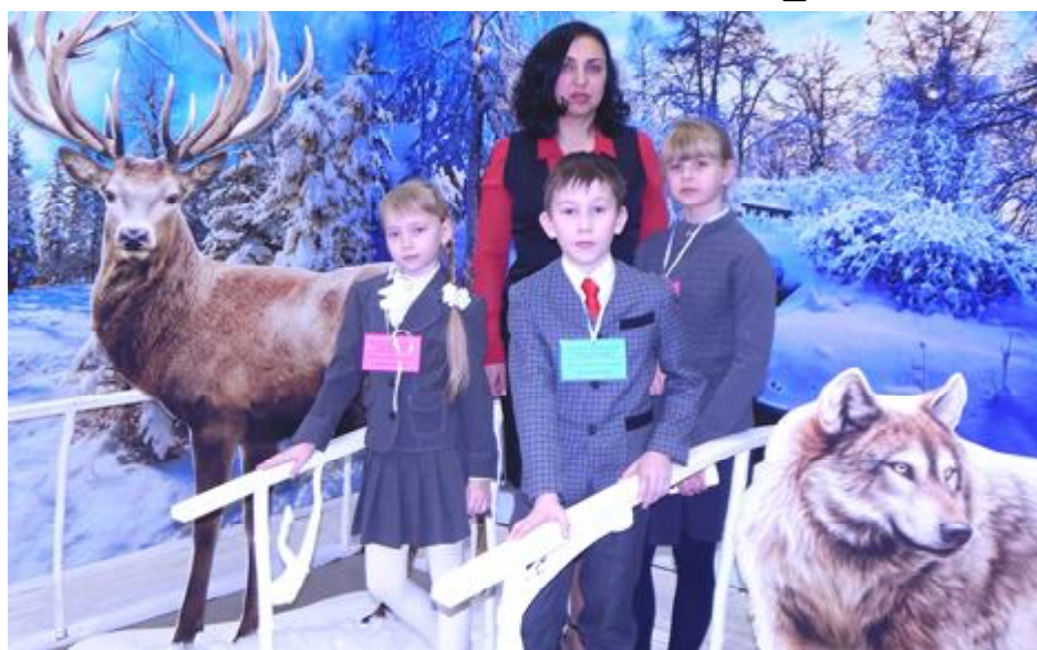
Команда Центра развития творчества детей и юношества заняла почетное третье место в конкурсе методических материалов

В финал конкурса, который состоялся 31 января 2018 г. в Центре развития творчества детей и юношества Нижегородской области, было отобрано 8 педагогов, в числе которых пощастливилось оказаться и мне.