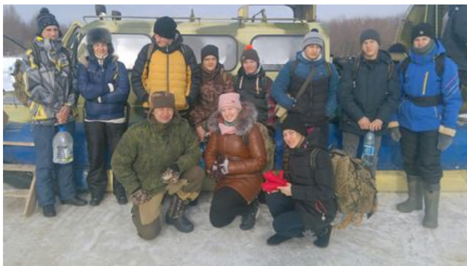
Делегация юных исследователей отправилась в Макарьевский монастырь

15 февраля 2018 группа ребят и двое сопровождающих из Большемурашкинской средней школы отправились в поход в женский Свято-Троице Макарьевский Желтоводский монастырь. Длительность похода составила 3 дня. Я и ещё девять отважных ребят передвигались на лыжах в сторону деревни (села) Ивановского, где и заночевали. На следующий день нам предстояла нелёгкая задача, добраться до Лысковской трассы, где нас ждал автобус. Автобус отвез на пристань, где перебравшись через волгу на воздушной подушке, оказались у Монастыря. Облик Макарьевского монастыря — это первое, что обращает на себя внимание. Укрепленные стены с дозорными башенками и массивными воротами, старинная надвратная икона над входом в «крепость» и великолепный собор. Именно Свято-Троицкий собор является главной постройкой монастыря, который по-