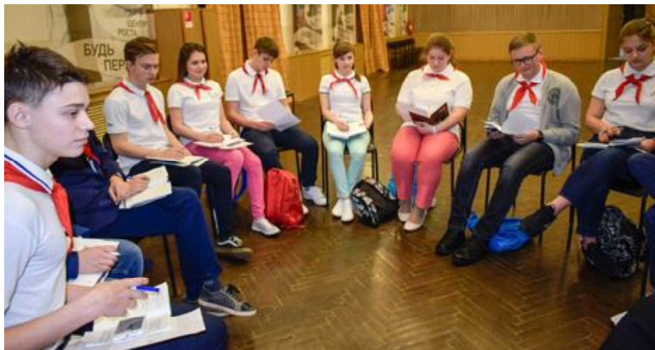
Детский областной совет лидеров разрабатывает проекты на благо развития нашей родины!

Какой я вижу Россию в будущем? Безусловно, только величайшей державой и никак иначе. Могу смело сказать, что это будет государство с сильнейшими экономическими и торговыми партнерами. Что касается науки, наши соотечественники сто лет назад и подумать не могли, что у нас, их потомков, будут газ и свет дома. Вся наша жизнь будет невозможной без виртуального общения. Техническая мысль сейчас движется с невообразимой скоростью. Признаюсь, мне трудно представить внешний облик нашей страны даже через пятьдесят лет. Могу предположить, что новым видом общественного транспорта станет машина, являющаяся чем-то средним между вертолетом и самолетом, какое-нибудь «умное» покрытие заменит привычный для нас асфальт. Прогресс, я надеюсь, также не оставит без внимания