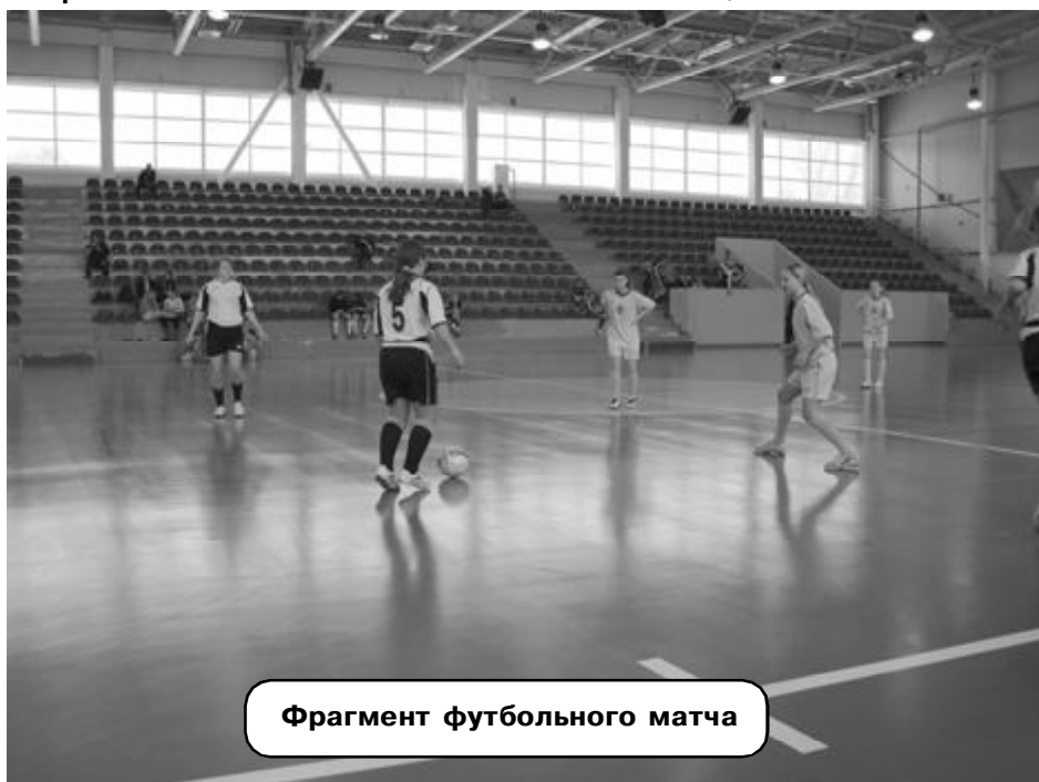
Фрагмент футбольного матча

Окончилось также первенство области по мини-футболу среди юношей 1996-1997 гг.р. По его итогам большемурашкинский «Прогресс» занял 4 место, пропустив вперед «Факел» (Бутурлино), имея с ним одинаковое количество очков, но проигрывая им по личным встречам, и две более сильные команды — «Волга» (Воротынец) и ДЮСШ-96 (Сергач).