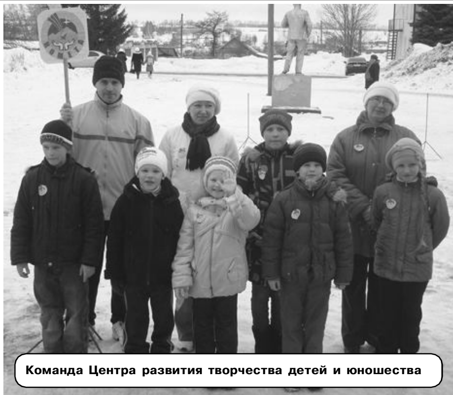
Команда Центра развития творчества детей и юношества