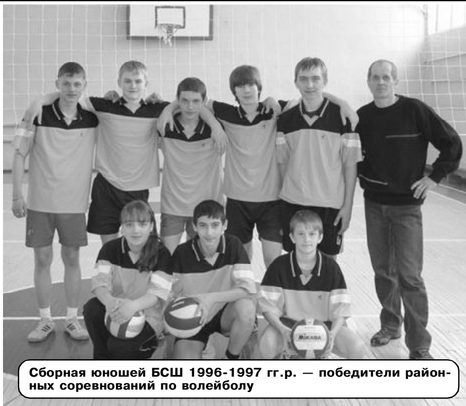
Сборная юношей БСШ 1996-1997 гг.р. — победители районных соревнований по волейболу