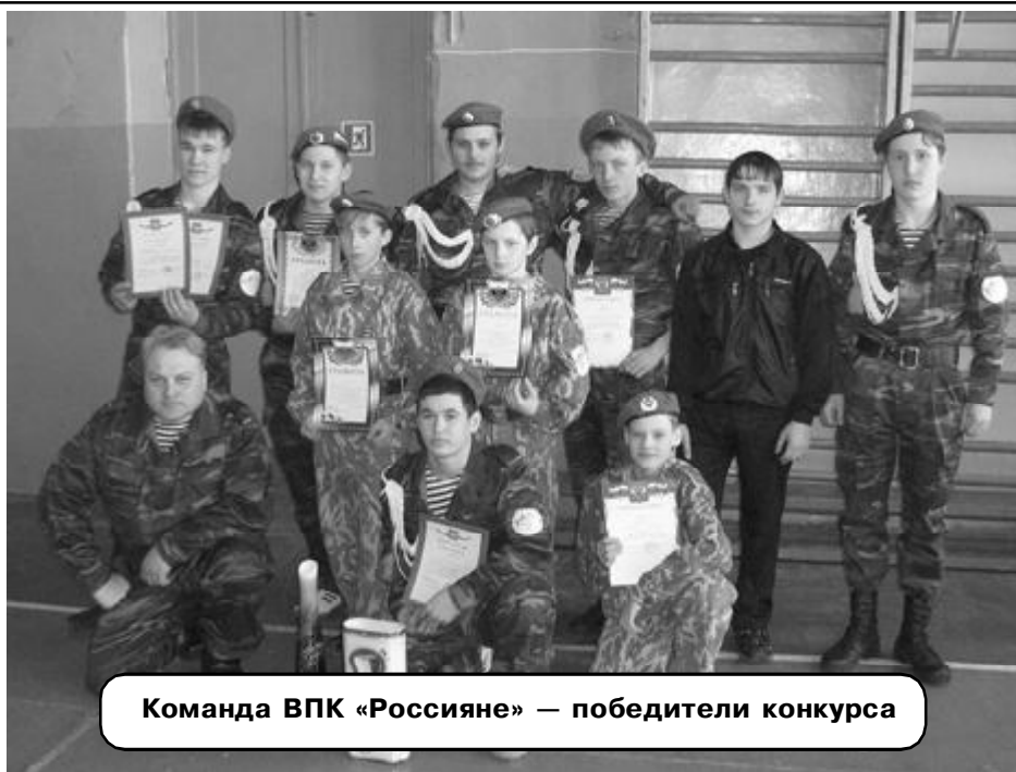
Команда ВПК «Россияне» — победители конкурса