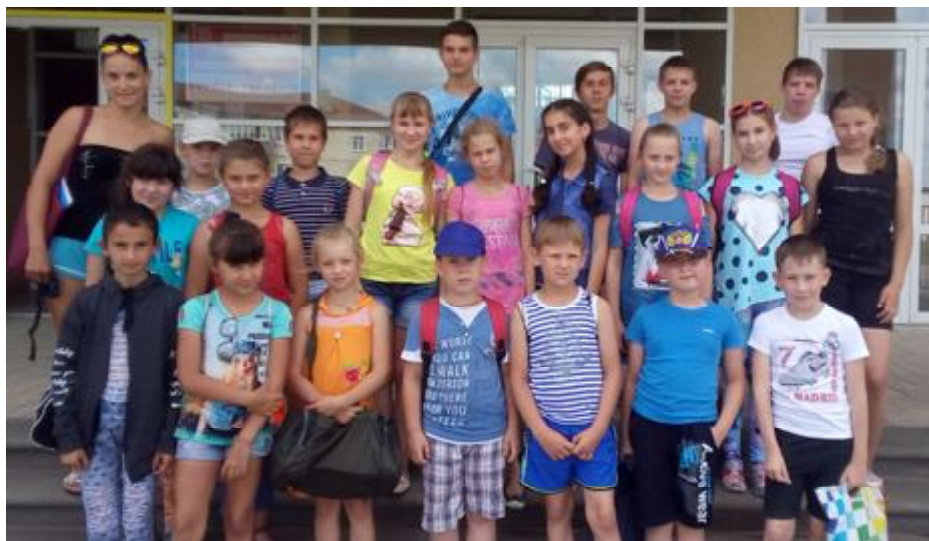
Дети с удовольствием посещали ФОК «Молодежный» г. Нягинино

Мастер-классы и творческие мастерские, проводимые на площадке вызвали увлечение и восторг, помогли обменяться опытом и открыть в себе новые таланты: «Веселые косич-