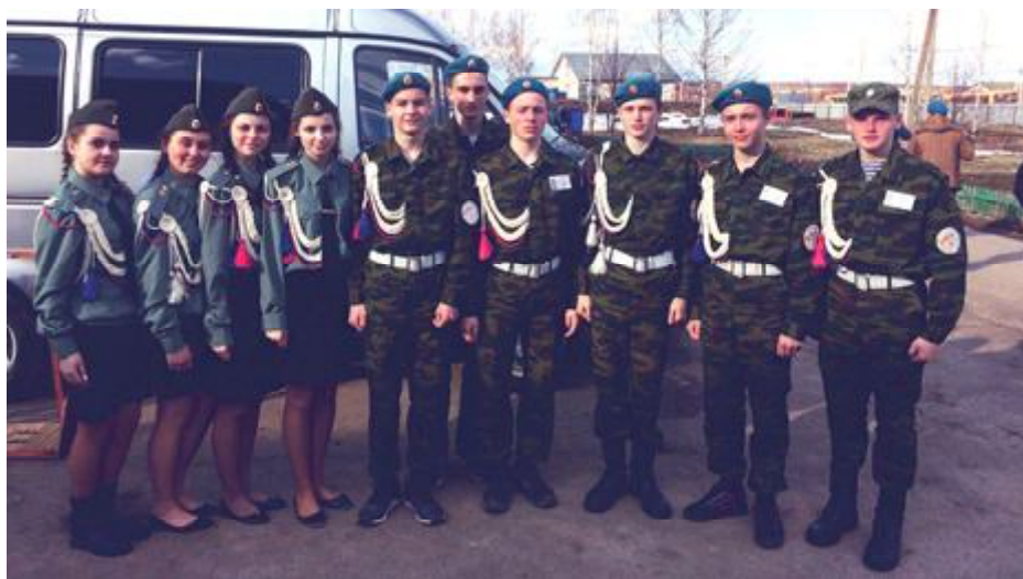
Победители зонального этапа - сборная Большемурашкинской средней школы