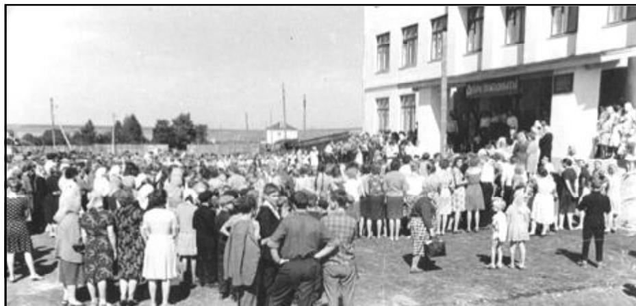
Открытие нового здания Большемурашкинской средней школы, 1964 год

Некоторые предметы тоже были другими. Например, вместо математики была арифметика, вместо окружающего мира - природоведение, а труд - это сегодняшняя технология. На уроках труда девочки учились шить и готовить, мальчики строгаги, выпиливали, мастерили что-то, учились ремонтировать мебель и технику. Раньше были октябрята, пионеры, комсомольцы. Каждый год принимали новых членов в их ряды. Маме «посчастливилось» быть только октябрёнком, а когда она должна была стать пионером, Советский Союз распался и всё отменили. Мама рассказывала, когда их принимали в октябрята, было тор-