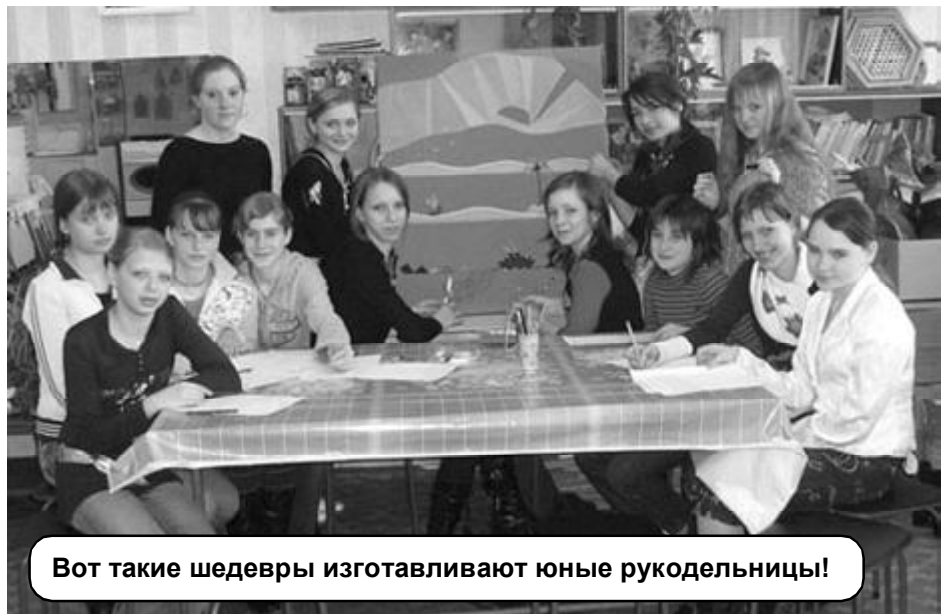
Вот такие шедевры изготавливают юные рукодельницы!