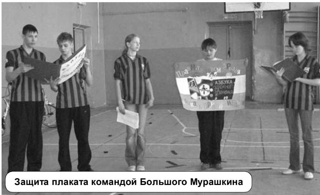
Защита плаката командой Большого Мурашкина