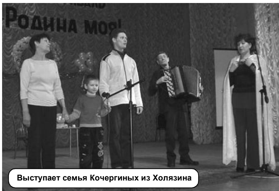
Выступает семья Кочергиных из Холязина