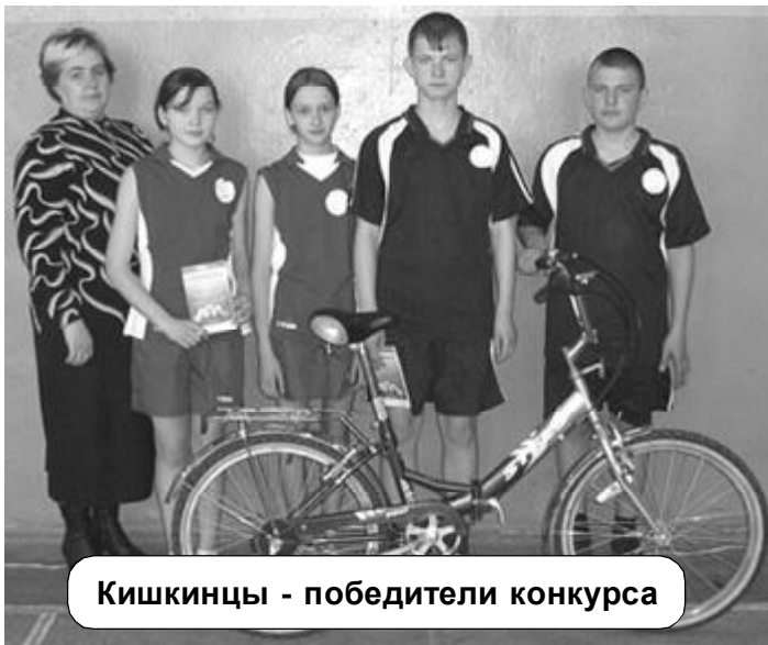
Кишкинцы - победители конкурса

Затем команды разошлись на теоретические конкурсы, указанные выше. Им предстояло продемонстрировать знания правил дорожного движения, ответив на соответствующие билеты, знания основ страхования от несчастных случаев на дорогах, проявить навыки оказания первой помощи в случае ДТП. В конкурсе «Юный журналист» каждый участник обязан был написать сочинение на одну из предложенных тем, таких как: «Бежит, бежит дорога от моего порога», «Мой друг — велосипед», «Азбуку дорожную знать каждому положено», «Дорогой товарищ водитель!..», «Есть такая должность — инспектор ДПС». После того, как теория была изучена, команды вновь собрались в спортзале на велозстафету, на которой надо было выполнить следующие условия: перенести стакан с водой с одной стойки на другую, не пролив его, объехать шайбы, проехать между двумя рейками (колея), проехать по «восьмёрке», а затем объехав выставленные в ряд кегли (змейка) отправляться на финиш.