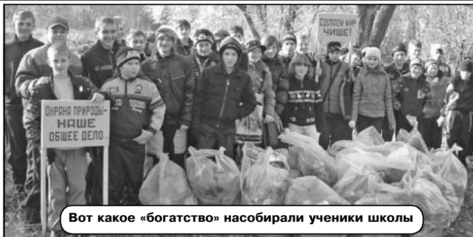
Вот такое «богатство» собирали ученики школы