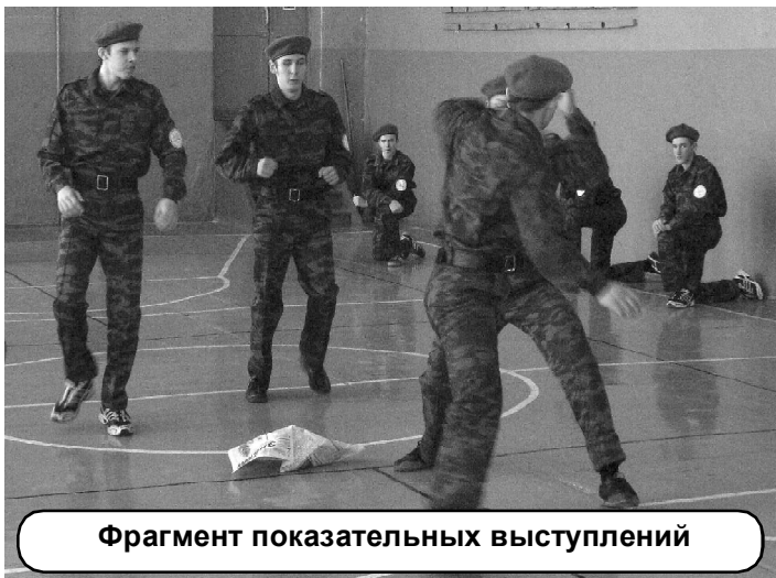
Фрагмент показательных выступлений

- ВПК создан с целью формирования у допризывной молодёжи морально-психологических и военно-патриотических качеств, необходимых для овладения теоретическими и практическими навыками основ военной службы. Основные задачи клуба: подготовка будущих защитников своего Отечества, формирование у моло-